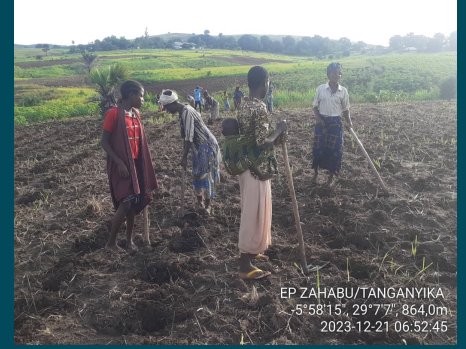
EP ZAHABU/TANGANYIKA -5°58'15", 29°7'7", 864,0m 2023-12-21 06:52:45